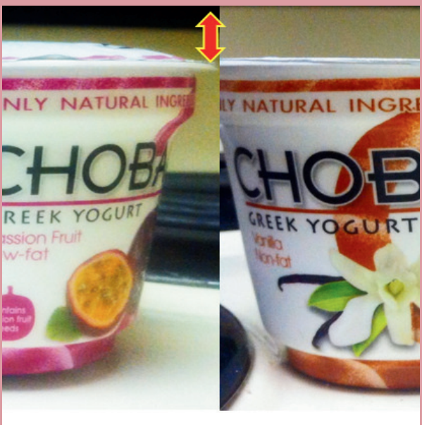
有鼓包、泄漏或凹陷的容器