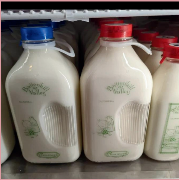
装在可退款玻璃瓶中的产品